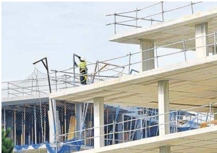
La construcción también es el sector que más recursos ha recibido de los fondos europeos.

La construcción, con 218 millones, es el sector que más recursos ha movilizado de estas ayudas ligadas a la recuperación tras el Covid