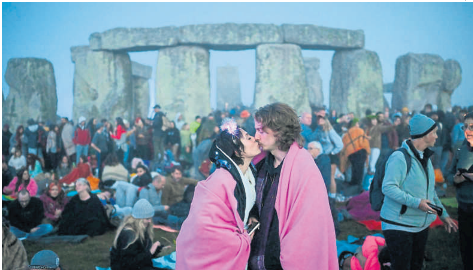
Culte al sol (i a l'amor). Nombroses persones van celebrar ahir al monument megalític de Stonehenge, al sud d'Anglaterra, el solstici d'estiu, el ritual ancestral del dia més llarg de l'any a l'hemisferi nord