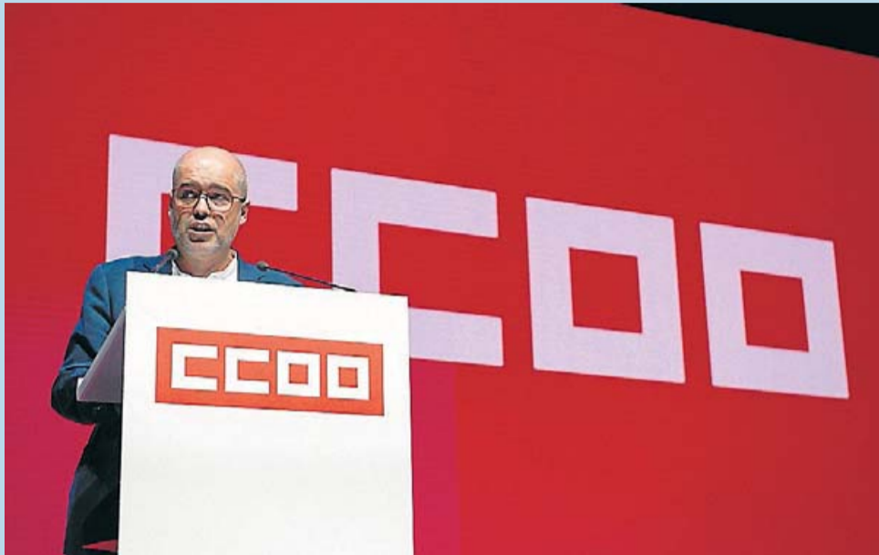
El líder de Comissions Obreres, el biscaí Unai Sordo.