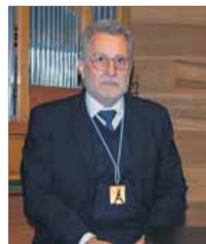
Pons, ahir ■ J.C. ROMERO

Qui et diu que no es discuteix sobre la monarquia. Quan ho revises, t'adones que tot va ser una pantomima. Ara és un moment de crisi i això vol dir que toca un canvi. Amb el 23-F va començar tot (alguna cosa es va pactar que no sabem). Es van començar a restringir les llibertats. Algú va pensar que Suárez havia anat massa lluny i es va provar de deduir els avenços democràtics. Pensa, a més, que jo soc l'únic de la companyia que recorda el 23-F. Dos ni havien nascut, i l'altre actor tenia només cinc anys. Veure totes les manipulacions posteriors esgarrifa. I ara que es coneixen algunes cartes de militars, ja cal que estiguem atents. O es redreça la democràcia o s'ha de pensar en una refundació. ■