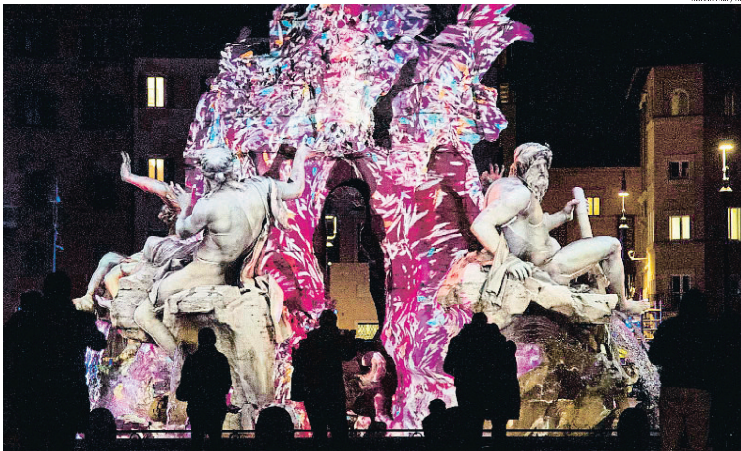
ACOLORINT BERNINI. Una descàrrega bigarrada de color inunda la font dels Quatre Rius, l'obra de Bernini que domina la plaça Navona, gràcies a una projecció de mapping que forma part de la decoració de la ciutat eterna per les nits d'aquest Nadal.