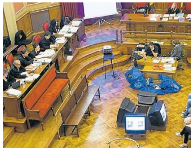
Un moment d'un judici a l'Audiència de Barcelona. MANOLO GARCIA

La investigació analitza 55 vistes amb interpretació en anglès, francès i romanès de 10 jutjats pe-